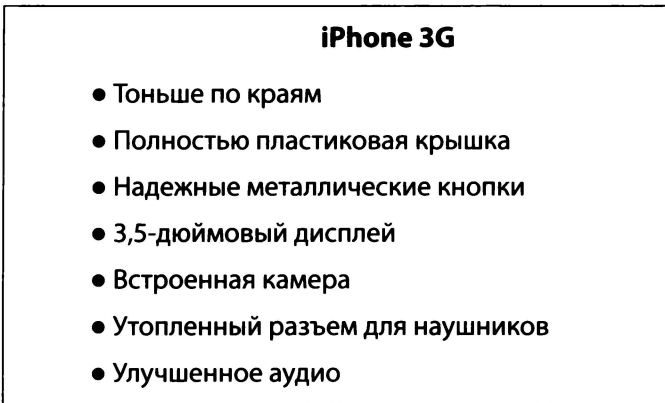
Рис. 8.2. Занудные слайды заполнены словами и не имеют графики

Когда Стив Джобс представлял MacBook Air в качестве «самого тонкого в мире ноутбука», один из слайдов представлял собой фотографию компьютера, стоявшего на конверте, который был толще компьютера. Вот так просто. Никаких слов, никаких текстовых врезок, никаких графиков — просто фотография. Насколько более мощными могут стать ваши выступления? Чтобы представить, какие слайды обычно делают посредственные выступающие для описания технического продукта, посмотрите на рис. 8.3 . Верьте или нет, но этот пародийный слайд выглядит просто лебедем среди сотен гадких утят, которых мне пришлось увидеть на презентациях! Это смесь шрифтов, стилей и текста.